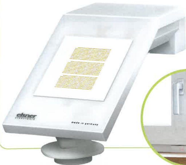
Anschriften Seite 69

Elsner Elektronik ist auf alle Arten von Wetterstationen und Strahlungs-Messern spezialisiert, vor allem für die KNX-Technik ( www.elsner-elektronik.de ). Fensterkontakte gibt es in allen Systemen. Nebenbei bestätigen sie, ob beim Verlassen des Hauses die Fenster zu sind (unten rechts, www.loxone.com ).